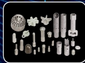
ЗАПЧАСТИ И ОБСЛУЖИВАНИЕ