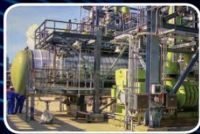
котел-утилизатор печи реакционной плавки