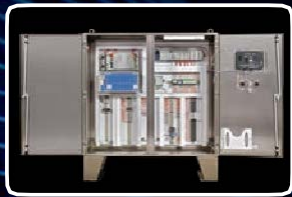
Система управления горелками