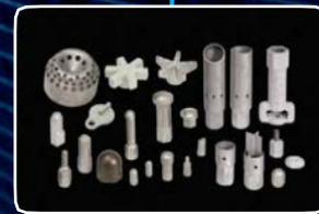
ЗАПЧАСТИ И ОБСЛУЖИВАНИЕ