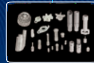
ЗАПЧАСТИ И ОБСЛУЖИВАНИЕ