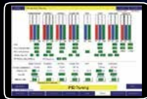
Настройка экрана ЧМИ системы регулирования процесса горения