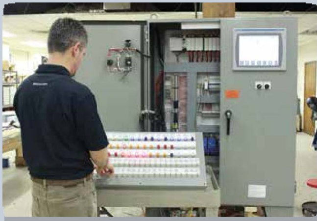
Моделирование безопасности системы управления горелками выполняется на работающем котле с несколькими горелками

Система управления горелками (BMS) и система регулирования процесса горения (CCS) ZEECO® гарантируют, что ваша работа будет соответствовать последним экологическим нормам и стандартам сверхнизких выбросов NOx, при этом максимально повышая эффективность и устраняя простои благодаря контролю старения оборудования.