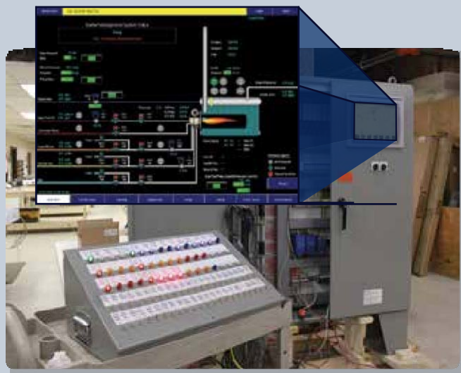
Экран ЧМИ для обзора системы управления горелками транспортабельного котла