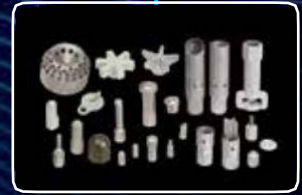
ЗАПЧАСТИ И ОБСЛУЖИВАНИЕ