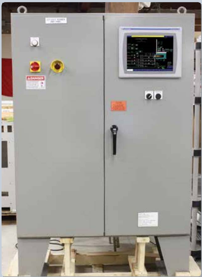
Полностью закрытая система управления горелками

Если вам нужно обновить или заменить систему управления горелками или систему регулирования процесса горения, сейчас самое время сделать правильный выбор. Выберите Zeeco и примените наши знания и опыт для себя.